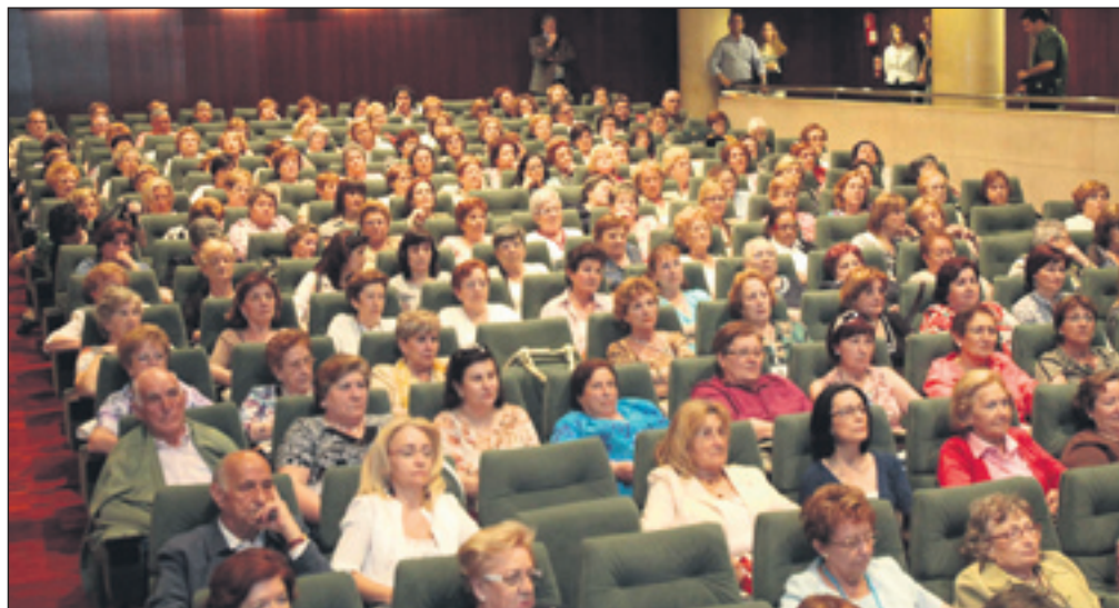
Numeroso público acudió a la inauguración del congreso. VI.

Y es que, desde Feaccu-Huesca, se ha concebido este congreso también como una oportunidad para dar a conocer las "riquezas"